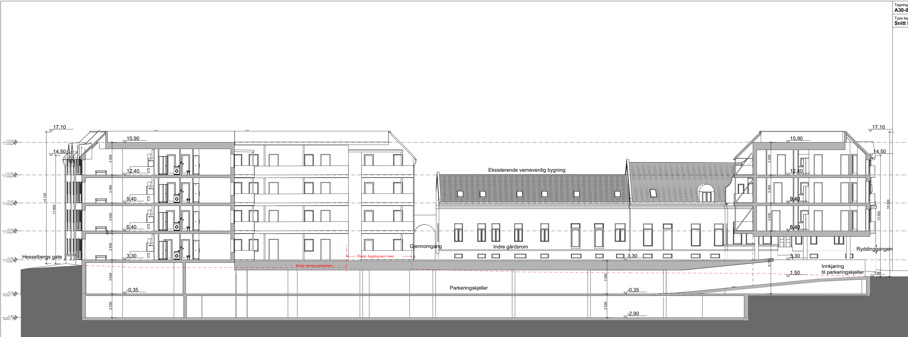
1:200 Snitt B